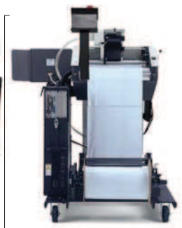
93 - 121 cm